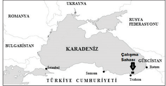
Şekil 1- Karadeniz'de büyüme kafesleri sahası

İstavrit balıkları doğadan Eylül 2010'da tuzak ağlar ile yakalanıp ilk önce 14 m çaplı HDPE (High Density Polietilen) malzemeden yapılmış 3 adet kafese stoklanmış, suni yeme bu kafeste alıştırma yapıldıktan sonra kontrolü daha kolay olan 5x5x3 m ebatlarındaki ağ kafese transfer edilmiştir. Çalışmada ağ kafes; tamamen birbirinden bağımsız, balıkların kaçma, birbirine geçme ve yem geçişi olasılığını ortadan kaldıracak şekilde tekerrür oluşturma amacıyla yeniden dizayn edilmiş (ebatları 5x1, 6x1.5 m; kafes ağı 10 mm göz açıklığında ve ağın su üzerinde kalan kısmının yüksekliği 1 metre) ve kullanılmıştır. Ağın tabanına akıntılardan en az seviyede etkilenmesi amacı ile 8 kg'lık 8 adet ağırlık bağlanmıştır. Kafesin üzeri kuşlardan koruma amaçlı 30 mm göz açıklığında çift kat kuş koruma ağı ile örtülmüştür.