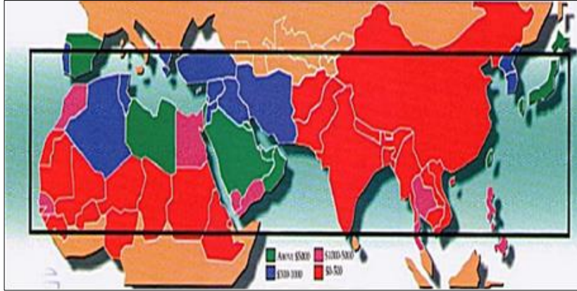
Harita 3: 1996 yılına göre 10/40 penceresinde yaşayan insanların ekonomik gelir düzeyleri 27