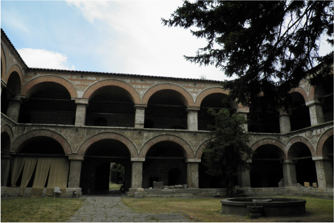
Resim 4. Kurşunlu Hanın Günümüzdeki Hali