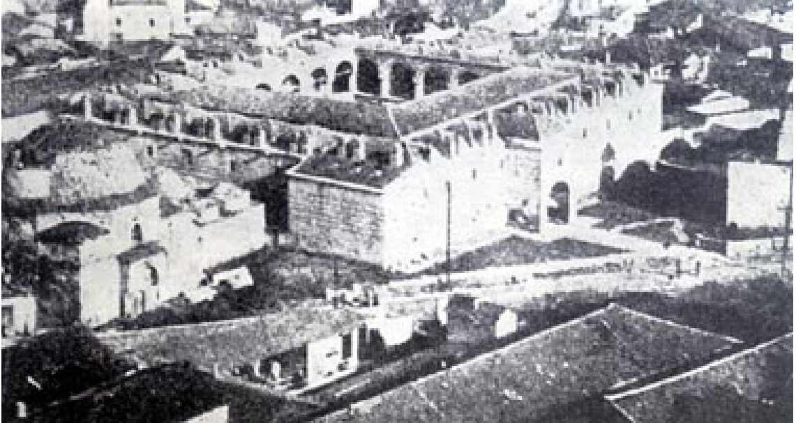
Resim 2. Kurşunlu Han ve Şengül Hamamı (Eski Hali)