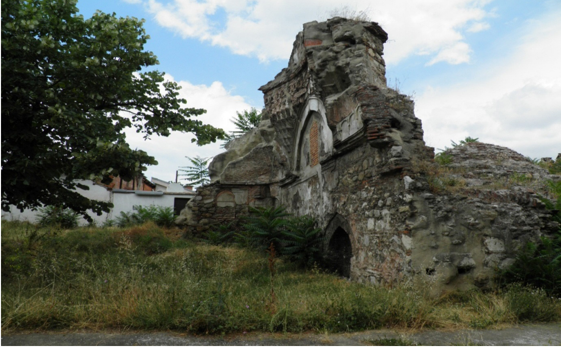
Resim 3. Şengül Hamamının Ayakta Kalan Son Kısmı