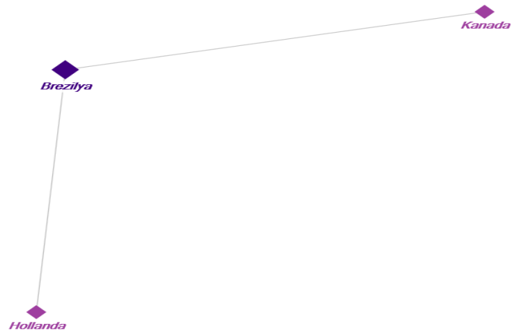
Şekil 4: -0.7 Eşik Değeri İçin Sosyal Ağ

Son olarak Şekil 4 ve Tablo 4'e bakıldığında, -0.7 eşik değeri için sadece Brezilya'nın Kanada ve Hollanda ile bağlantılı olduğu görülmektedir. Bir başka ifade ile Brezilya hisse senedi piyasası Kanada ve Hollanda piyasaları ile tamamen zıt yönde hareket etmektedir denilebilir.